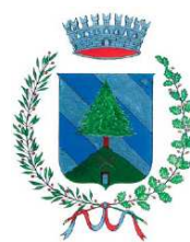
Comune di Fierozzo