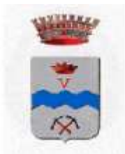
Comune di Sant'Orsola Terme