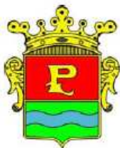
Comune di Pergine Valsugana